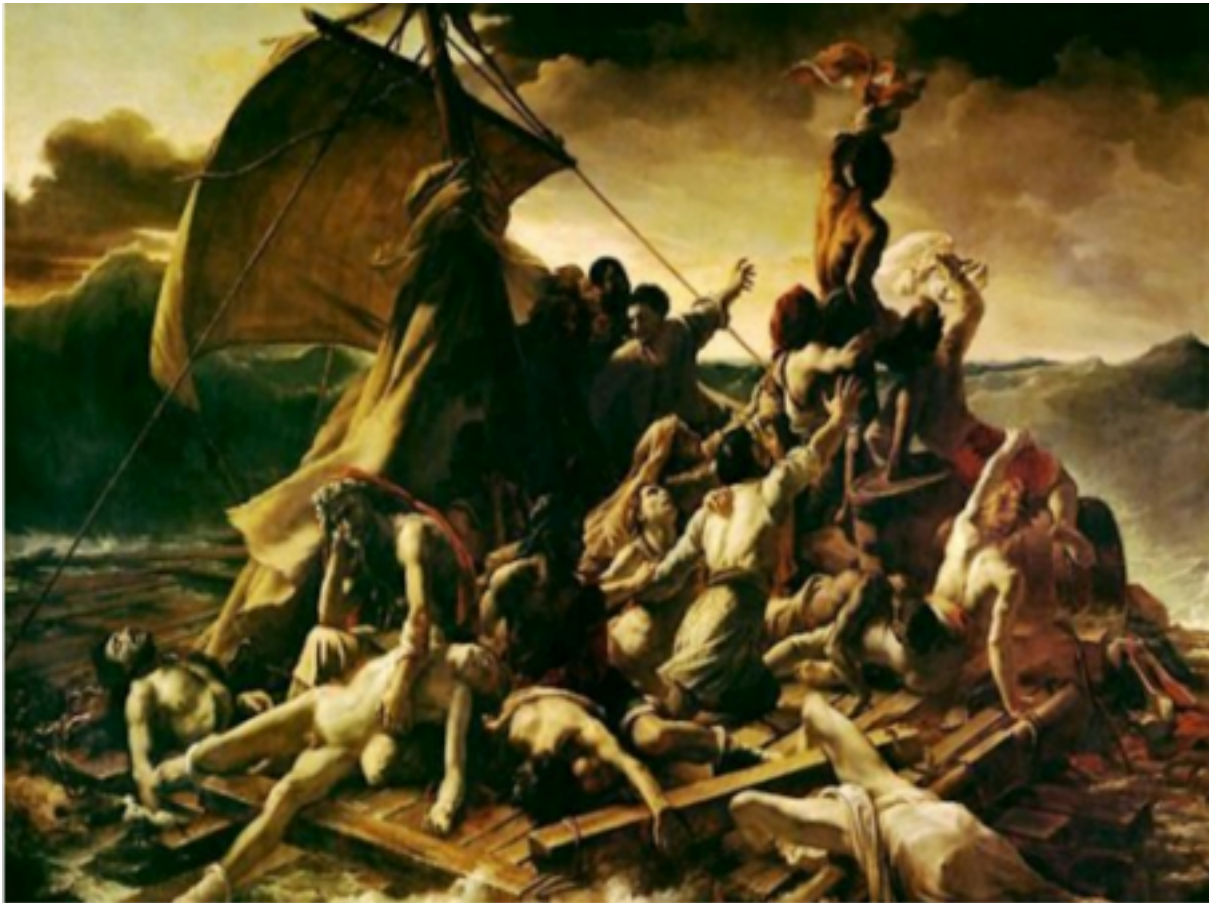
Afb. 2. Het Vlot van de Medusa uit 1818 van Théodore Géricault

Kannibalisme geeft voedsel aan mythevorming. Het opheffen van een taboe ('nood breekt wet') dat mensen reduceert tot beesten spreekt uitermate tot de verbeelding en tovert historische tragedies om tot speelfilms, romans en zelfs tot parodieën. Ja, er mag gelachen worden, of beter gezegd: de mens wordt nerveus van drama's en maakt er grapjes over om zijn angst te bedwingen. Vooral de populaire cultuur wordt gekenmerkt door een onbedwingbare drang om het iconische te ontheiligen, waardoor bijvoorbeeld het schilderij Het Vlot van de Medusa uit 1818 van Théodore Géricault (afb. 2)* een afterlife heeft gekregen in een ontzagwekkende veelvoud van melige en zowaar ook enkele serieuze varianten (afb. 3 en afb. 4). Smakeloosheid is daarbij een stijlkenmerk: Brittany Ferries maakte een advertentie met het doek van Géricault en zette erbij dat er tegenwoordig aangenamer manieren zijn om de zee (afb. 5).