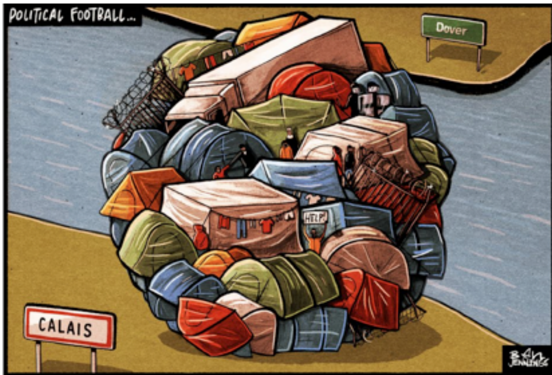
Afb. 25. Jennings

Schipbreukeling en bootvluchteling: woorden die een overlappende betekenis hebben maar totaal verschillende associaties oproepen. Bij 'schipbreukelingen' denk je aan onbewoonde eilanden, bij 'bootvluchtelingen' aan het NOS Journaal. In de verbeelding van schilders en tekenaars worden het vlot van de drenkeling en de rubberboot van de migrant één.