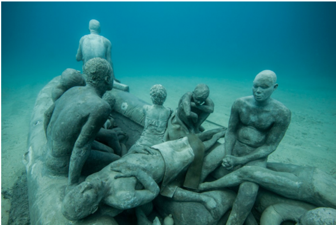
Afb. 7. 'The Raft of Lampedusa' van de Britse kunstenaar James deCaires Taylor