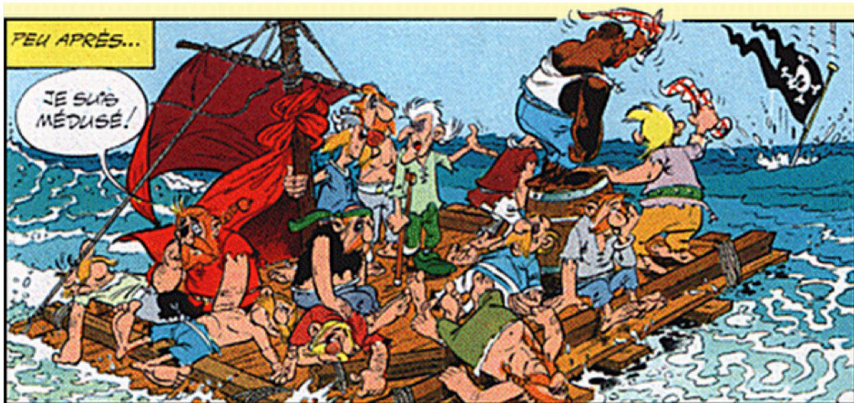
Afb. 4. Roodbaard, Uderzo