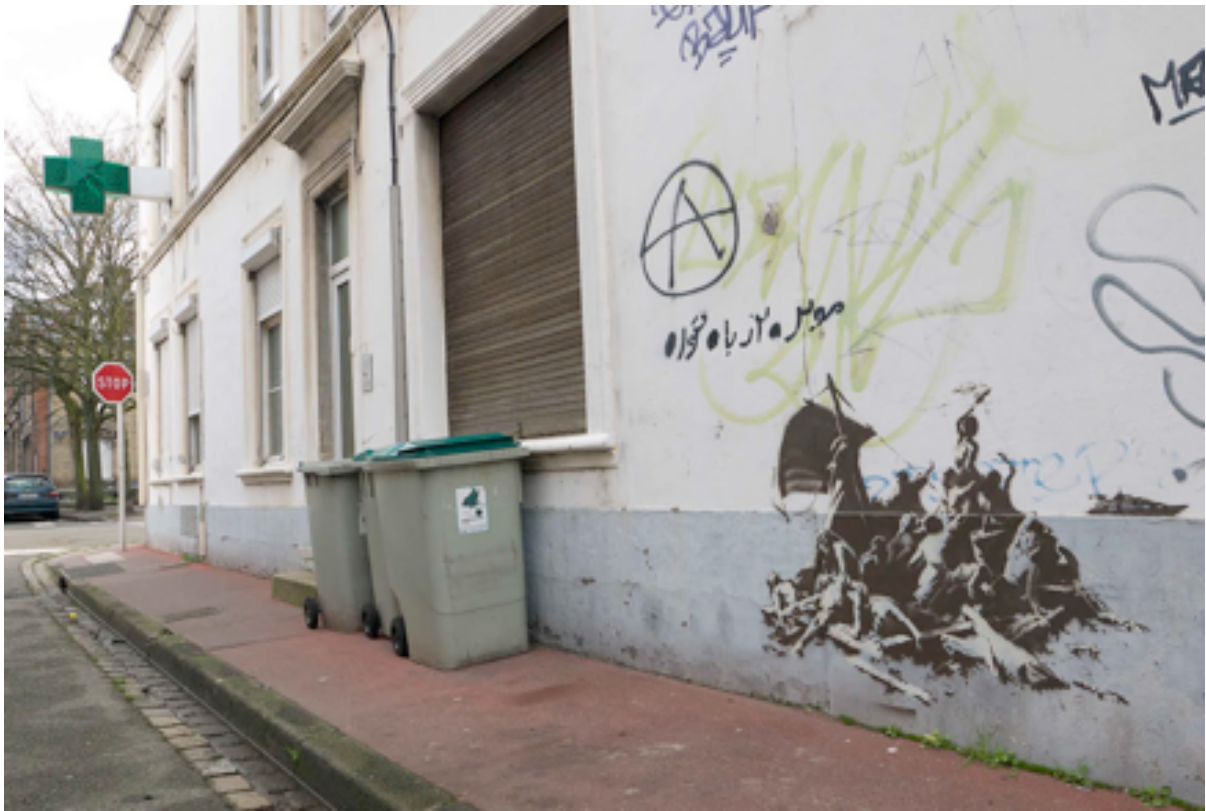
Afb. 8. Banksy, Jungle Refugee Camp in Calais